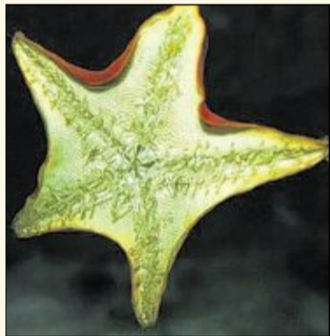
Seesterne haben einen scheibenförmigen Körper mit mindestens fünf Armen.

Generell sind Seesterne ziemlich gefräßig. Jeden Tag verschlingen die Räuber unzählige Muscheln, Schnecken oder Krebse. Die Beute eines Tages würde zusammen dreimal so viel wiegen wie der Seestern selbst. Im Magen des Roten Kammsterns, der im Mittelmeer lebt, haben Forscher einmal mehr als 20 Muscheln und Schnecken gefunden. (Seite III)