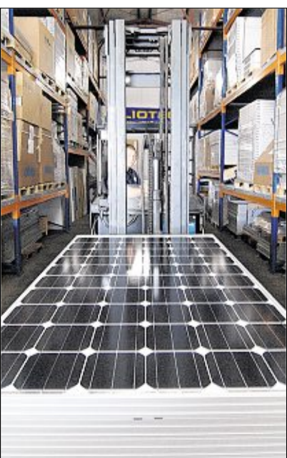
In dieser Lagerhalle in Regensburg liegen Module im Wert von mehreren Millionen Euro.