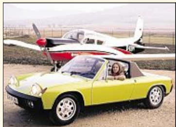
Der VW-Porsche wurde nie richtig ernst genommen

VW und Porsche – das scheint eine Hassliebe zu sein, die bereits vor 40 Jahren ein ungewöhnliches Kind hervorbrachte: den VW-Porsche 914, ein aus heutiger Sicht wunderschönes und sehr begehrtes Automobil mit Targa-Dach und Mittelmotor. (Seite V)