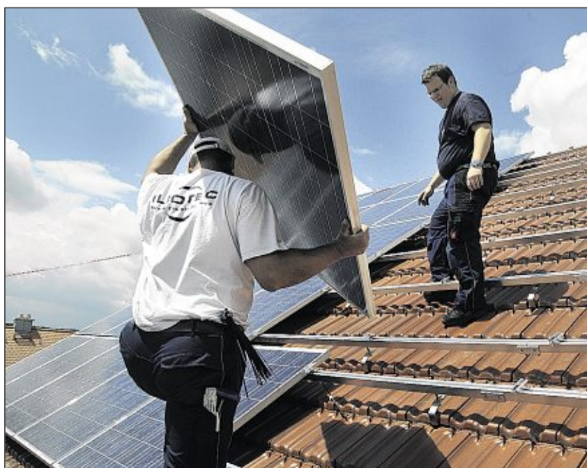
Die Iliotec hat bisher über 7000 „Sonnenanbeter“ gewonnen. Und täglich werden es mehr.